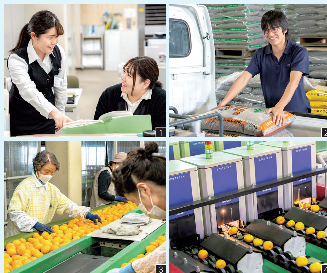
1 先輩と後輩の距離が近く何でも聞きやすいのが魅力(紀宝支店) 2 肥料の販売・積み込みもお任せを(三重南紀経済センター) 3 4 当地域のみかんは海外にも輸出しているブランド品。厳格なオートメーションと繊細な人の目と手の両方で良い品を選別(統一選果場)

農家さんを中心とした地域住民の生活を守り支えるための業務を推進するのがJA伊勢の使命。紀宝支店では金融をメインに営農支援など多彩な仕事を行なっています。組合員の農家さんを毎月訪問するなど、身近な関係性づくりがこの仕事の鍵。だからこそ、職場にも風通し良く親密な雰囲気があります。上司ではなくより身近な先輩が指導してくれるトレーナー制度や有給に追加して取れるリフレッシュ有給、男性も取得実績がある育休制度など、働きやすい環境づくりは万全。短時間勤務制度の導入による子育て中などの勤務時間調整もあり、誰もが生き生きと働けるやりがい溢れる環境です。