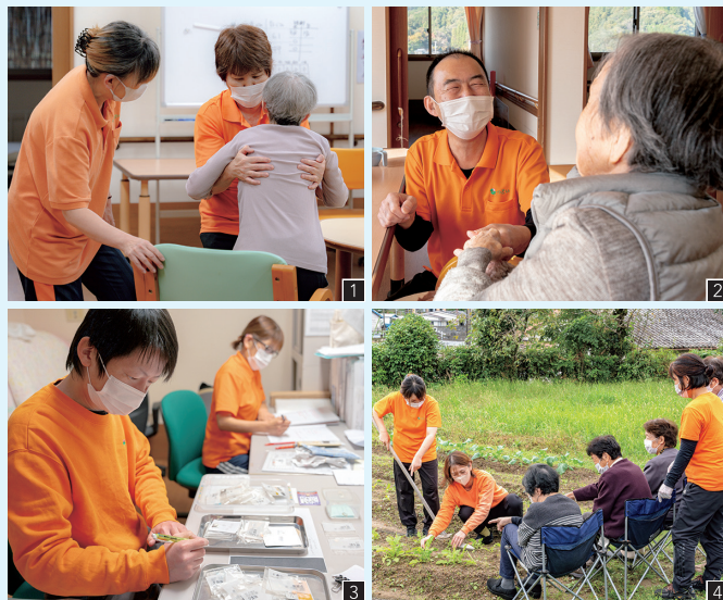
①利用者さんと身近な関係性づくり(ショートステイセンターつどい) ②笑顔あふれるにぎやかな空間(同) ③専門の看護スタッフが健康・服薬管理を徹底(同) ④目の前の畑でスタッフと利用者さんが一緒に育てた野菜を食事に提供(宅老所つどい)

高齢者や在宅障害者ら誰もが地域社会で安心して生活を送れるよう、「その人らしい生活を支えること」を理念に介護保険事業等を展開している「つどい」。紀宝町と御浜町にある6つの施設で、介護や看護、リハビリなどのスタッフを募集しています。資格取得やスキルアップのための研修会にも積極支援。何より魅力なのは、職員同士の関係性が密で、何でも相談しやすいアットホームな雰囲気。先輩たちが仕事内容を手厚く教えてくれるから、働きやすく馴染みやすいと評判です。実際にどの施設も笑い声で溢れ、活気に満ちた空気感。利用者さん、そして職員同士の気持ちに寄り添う優しい職場です。